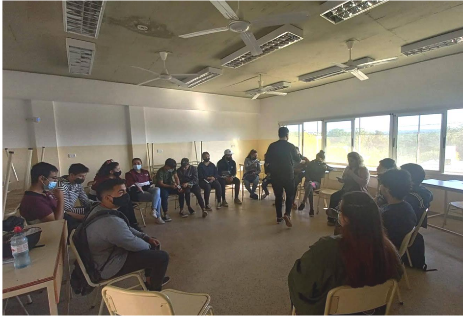
Elección de cuerpo de delegadxs, 2021